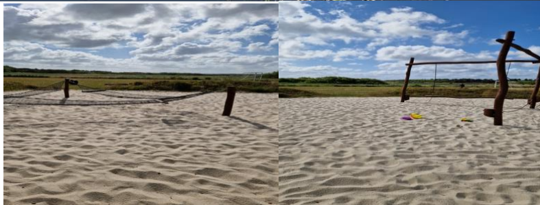
Landskabet mod det ønskede bebyggelsesområde jf. §21 Området 7B Søndervig.