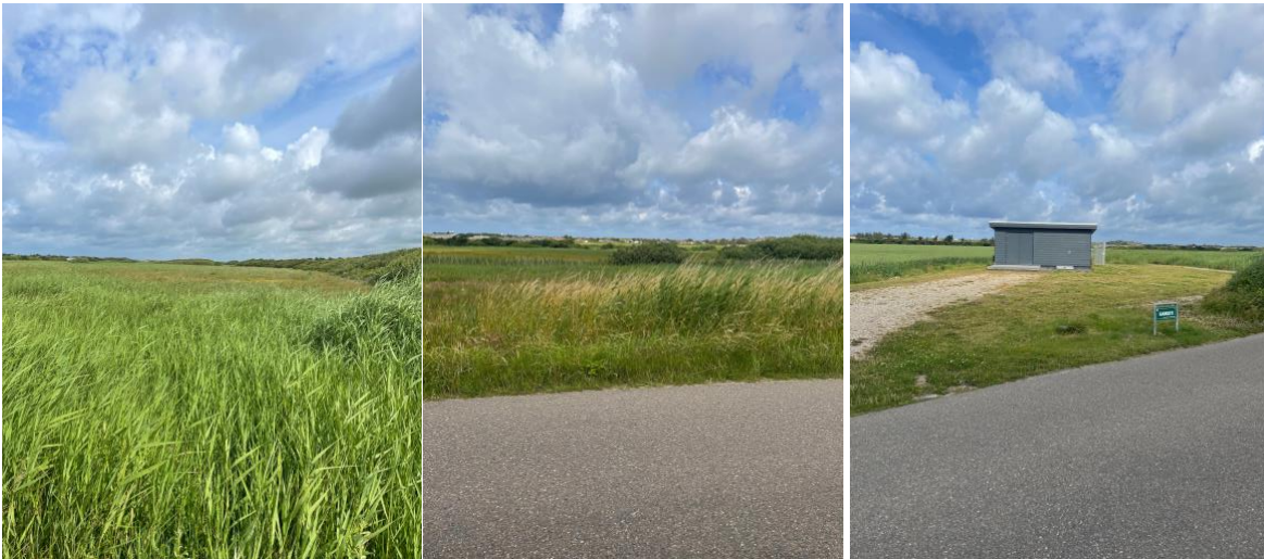
Landskabet mod det ønskede bebyggelsesområde jf. §20 Området 7A Søndervig